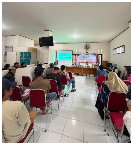
Gambar 2. Dokumentasi Kegiatan PkM

merupakan strategi yang efektif dalam upaya pencegahan penyakit akibat kerja dan peningkatan kesehatan nelayan.